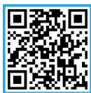
오시는 길 (네이버지도)